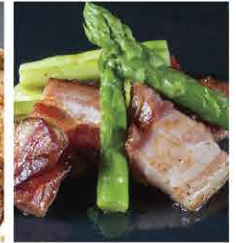
北海道直焼きベーコンとアスパラガス