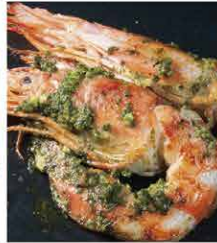
あし赤海老バジリコンソテー