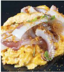
しろイカとタマゴのカラスミ掛け