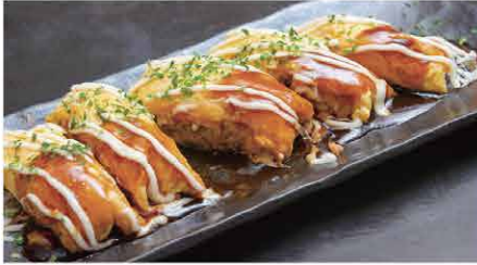
日南もち豚とん平焼き